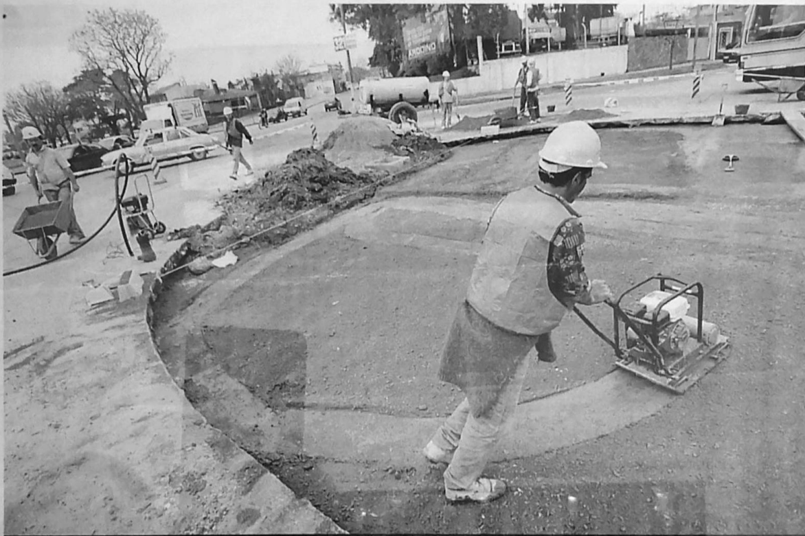
CENTENARIO Y MONTE CASEROS . Las obras tienen la finalidad de evitar la gran cantidad de accidentes que se producen en el cruce

La Intendencia de Montevideo trabaja en el flechamiento de calles y en la colocación de semáforos sincronizados por bulevar Batlle y Ordóñez, obra que insumirá un costo mayor a $ 3.000.000